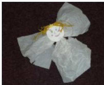
ukázky práce školní družiny